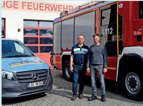
Zu Besuch bei der Feuerwehr in der Gemeinde Schorfheide

Im Rahmen des Landtagswahlkampfes ist Danko Jur oft mit seinem Wahlkampfmobilem „auf Tour“, besuchte schon viele Orte und Einrichtungen und traf sich dort mit Bürgermeistern, Vertretern von Feuerwehren und Vereinen, Unternehmern und prominenten Bürgern. Dabei konnte der Landtagskandidat viele Informationen und Eindrücke sammeln, wie er erklärt.