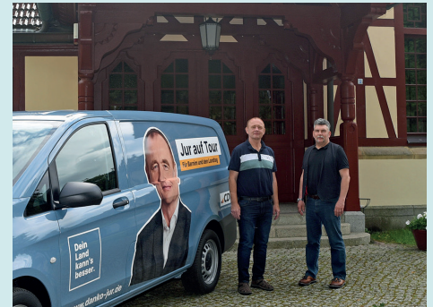
Am Joachimstaler Kaiserbahnhof mit Bürgermeister René Knaack-Reichstein